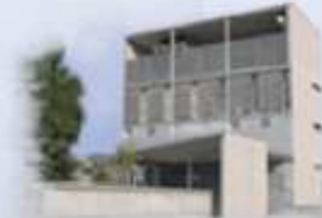
ABS Bases de Manresa