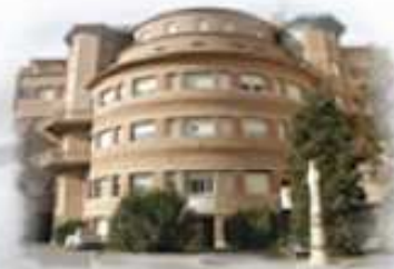
Clínica Sant Josep