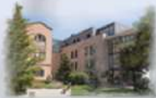
ABS Barri Antic