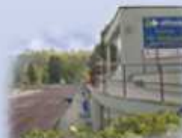
Medicina de l'esport