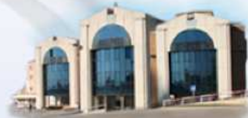
Sant Joan de Déu